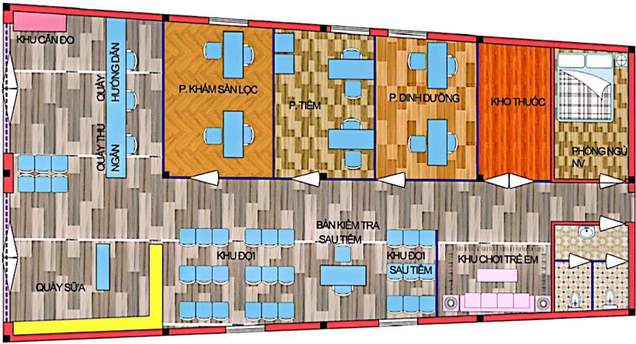
MẶT BẰNG PHÒNG TIÊM CHỦNG