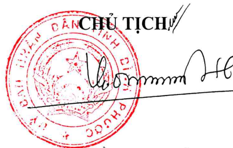
Trần Tuệ Hiền