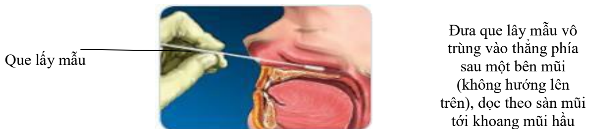
Hình 1: Lấy dịch tỵ hầu

Lưu ý: Đối với trẻ nhỏ đặt ngòì trên đùi của cha/mẹ, lưng của trẻ đối diện với phía ngực cha mẹ. Cha/mẹ cần ôm trẻ giữ chặt cơ thể và tay trẻ. Yêu cầu cha/mẹ ngả đầu trẻ ra phía sau.