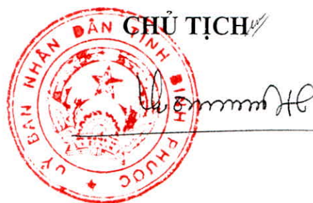
Trần Tuệ Hiền