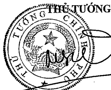
Phạm Minh Chính