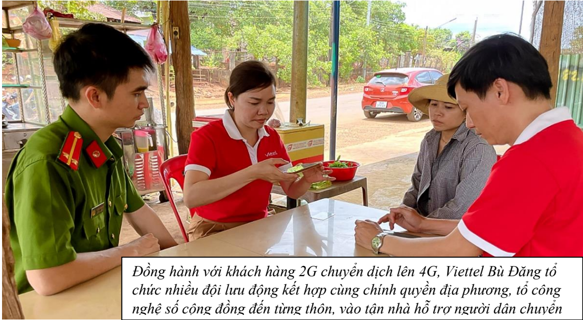
Đồng hành với khách hàng 2G chuyển dịch lên 4G, Viettel Bù Đăng tổ chức nhiều đội lưu động kết hợp cùng chính quyền địa phương, tổ công nghệ số cộng đồng đến từng thôn, vào tận nhà hỗ trợ người dân chuyển

Trước khi phát động đợt cao điểm, Bình Phước còn khoảng 80 ngàn công dân chưa kích hoạt tài khoản ĐDDT; 211 ngàn thuê bao cần nâng sóng 2G lên 4G. Trong đợt cao điểm này, tỉnh không chỉ đặt mục tiêu hoàn thành các chỉ tiêu đã đề ra mà còn hướng đến mục tiêu xa hơn là nâng cao nhận thức nhân dân về vị