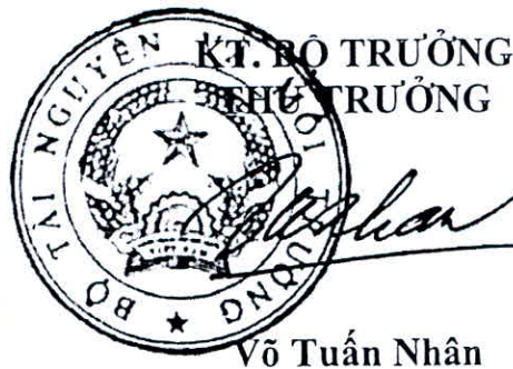
Võ Tuấn Nhân