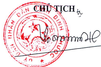
Trần Tuệ Hiền